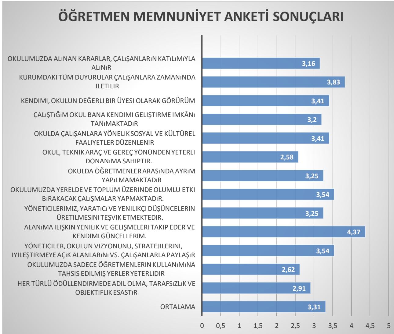
Grafik 1: Öğretmen Görüş Ve Değerlendirmeleri Anket Formu Veri Analizi