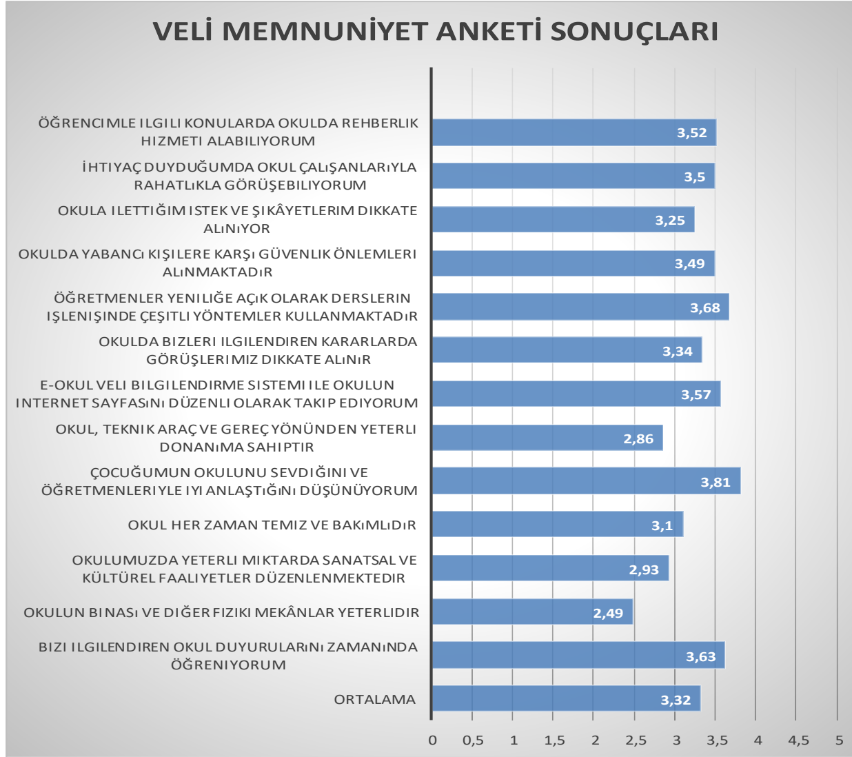
Grafik 1: Veli Görüş Ve Değerlendirmeleri Anket Formu Veri Analizi